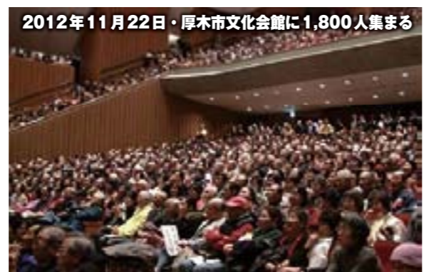
2012年11月22日・厚木市文化会館に1,800人集まる