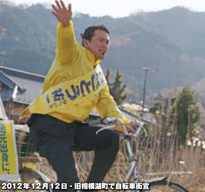
2012年12月12日・旧相模湖町で自転車街宣

(2) 神奈川16区小選挙区惜敗 の要因 あったと考えます。 第一に、投票率が58%と前回 2009年の68%から約10%も 減ったことです。第二に、維新 の会候補が出馬し、「反自民票 が割れたことです。無党派の支 持では大幅にリードしていたこ とからすると、投票率ダウンと 維新出馬はともに私に不利に働 いたと考えられます。(神奈川 新聞の出口調査によれば「支持 なし層」のうち46%が私に、 28%が自民候補、17%が維新候 補に投票) 第三に、こ れまでの選 挙で比較的 優勢であっ た厚木市と 相模原南区 が、低投票 率だったこ ともあり得 票率が伸び なかったこ とです。横 浜市の民主 候補が全敗