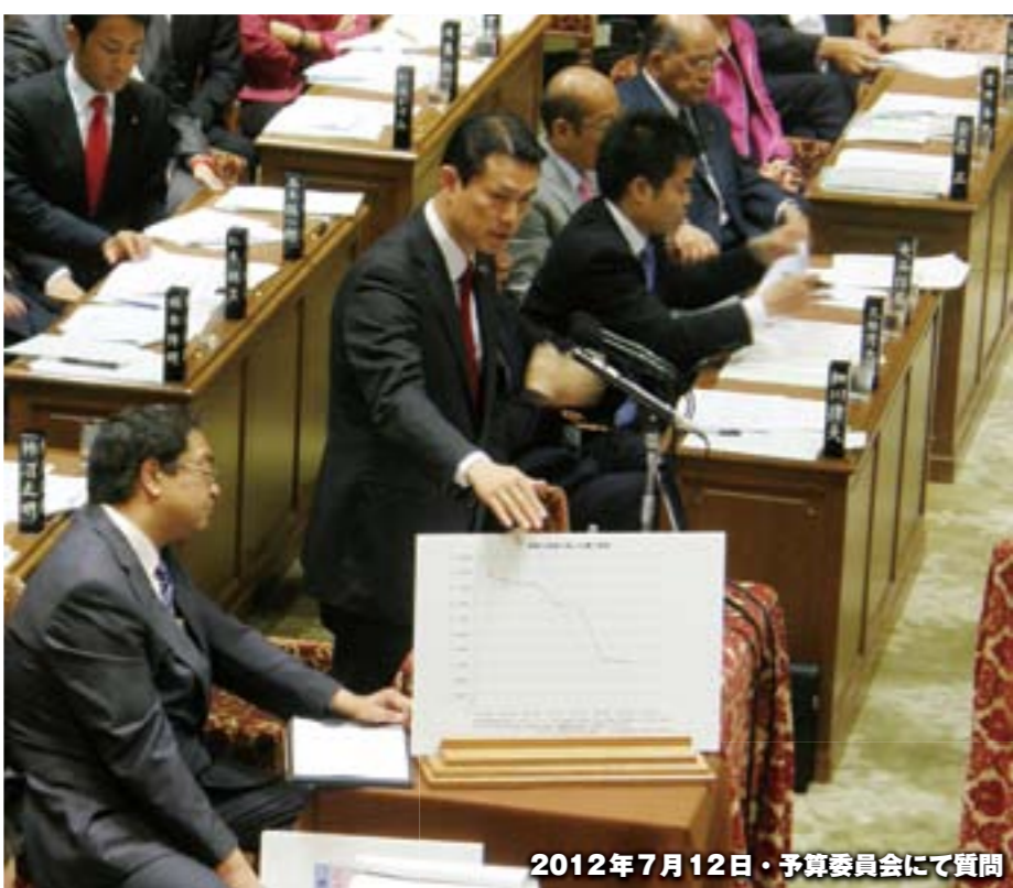
2012年7月12日・予算委員会にて質問

成果（右ページ右下参照）を明らかにし、自公政権がこれらを維持するの破棄するのかを国会論戦で明らかにしていきます。第二に、成果が不十分だったものについては、その原因を分析の上、党内議論を経て、今後の改革の方向と実行への意志を明らかにし、維新の会・みんなの党と比べても改革内容と実行可能性で上回ると国民に判断して頂けるレベルまで磨き上げていきます。これが新生民主党（ニュー・デモクラツク）の目指すべき方向と考えます。