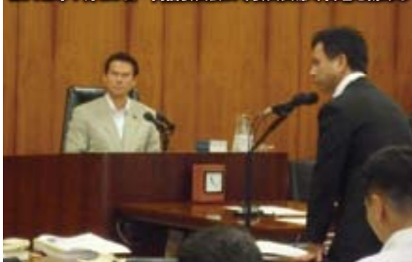
2012年7月20日・内閣委員会にて委員長席で代理を務める