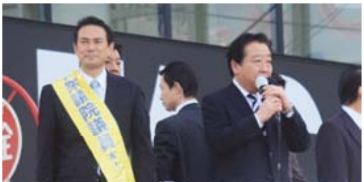
2012年11月29日・伊勢原駅南口での野田首相応援演説に約1,000人集まる

比例で民主党以外に投票し小選挙区で私に投票する方が多かったことです（小選挙区の得票90881票に対し、民主党の比例票は45676票と約半分）。支援頂いている多くの皆様が、大逆風にもかかわらず「党派を超えて後藤をよろしく」と呼びかけて頂いたおかげだと思われまます。なお、自民党候補の小選挙区得票98958票に対し、自公合計の比例票は97876票とほぼ等しい結果でした。