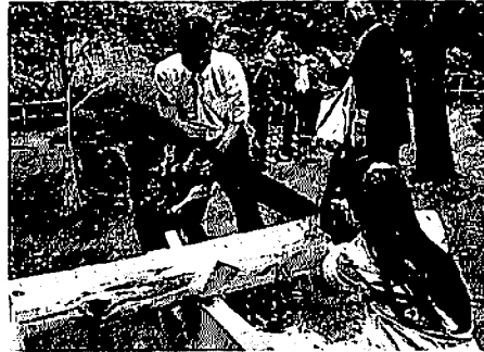
11/3 厚木七沢森のまつり