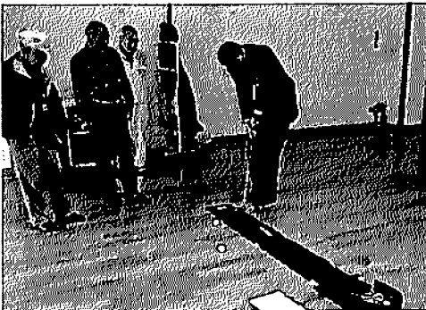
11/19 厚木市南毛利公民館 シニアフェスティバル