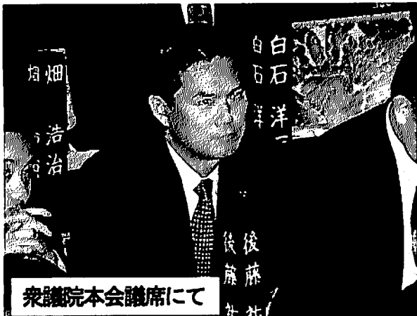
衆議院本会議席にて