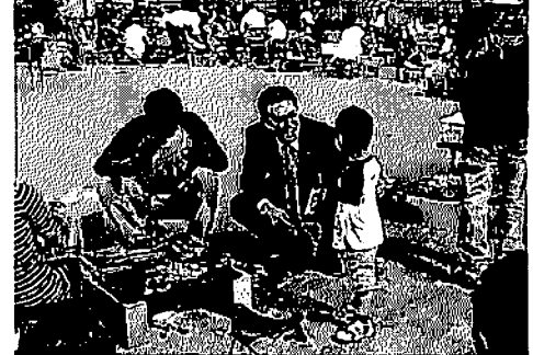
10/23 厚木林自治会のバーベキュー大会