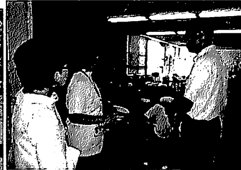
神奈川県総合リハビリセンター視察 (厚木市七沢)