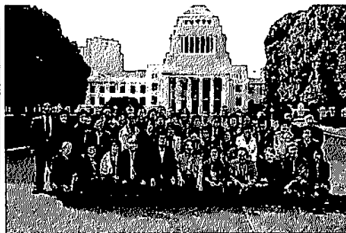
11/15 愛川支部国会見学バスツアー